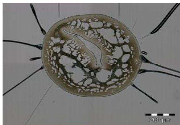
Abb. 1 und 2: Entwickelte Hohlfasertypen